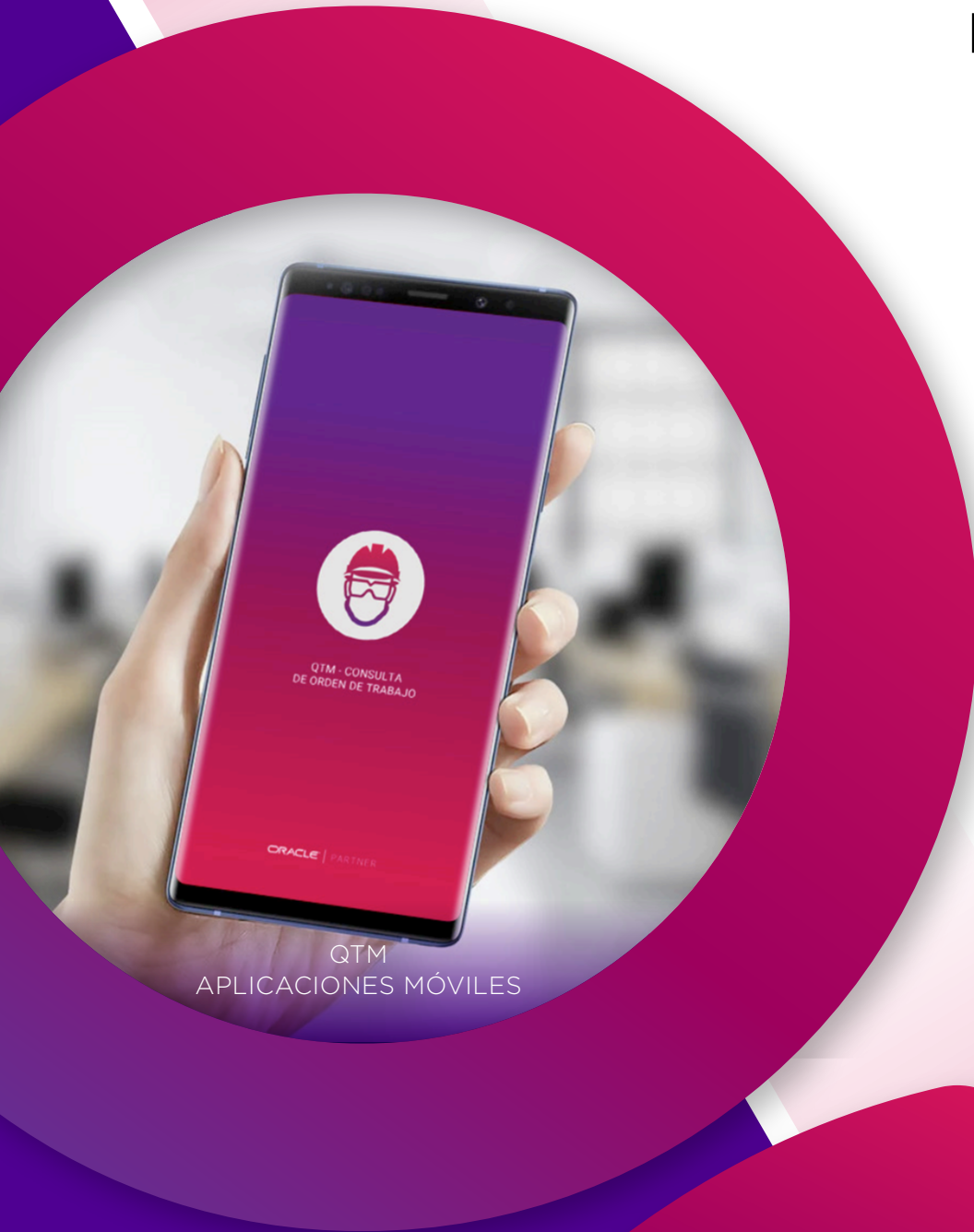
QTM APLICACIONES MÓVILES